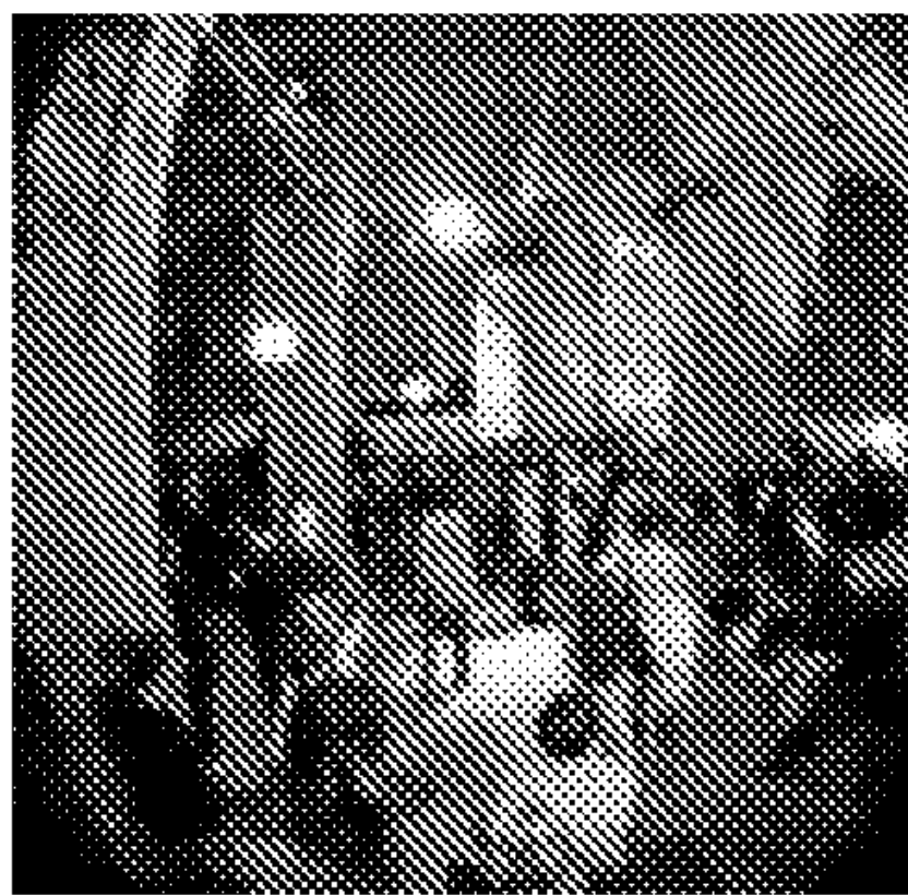
Nel mirino il circolo Arci Cassero

A difendere l'attività del Cassero e la convenzione in essere con il Comune è intervenu-