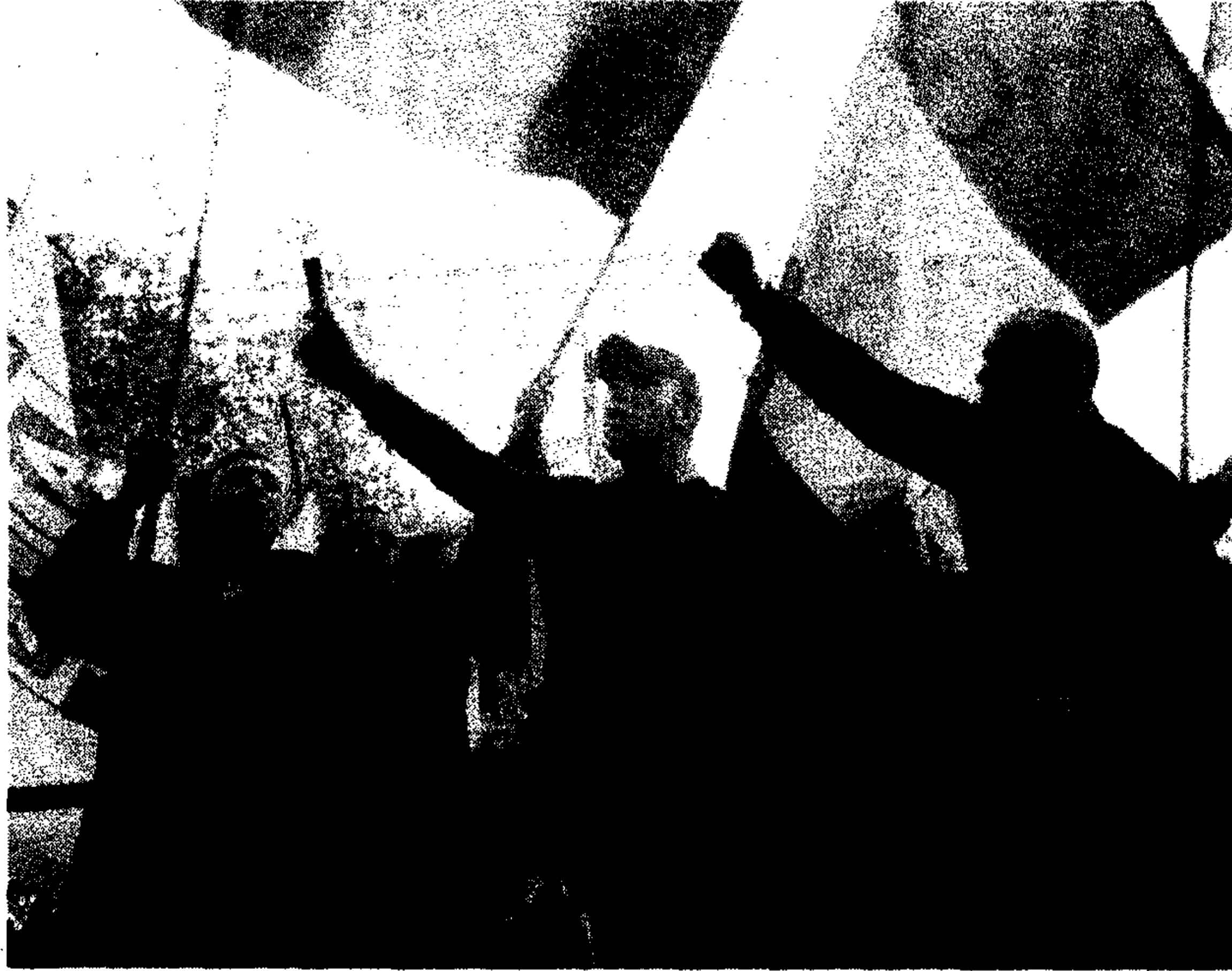
Un momento di una manifestazione fascista